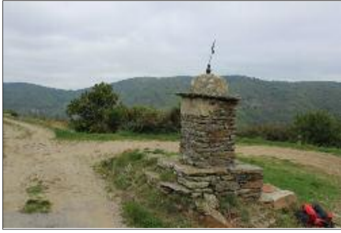
Départ Croix de Nojaret (altitude 765m)

Le topo en images. Si vous êtes en famille donnez ces photos à vos enfants. Elles leur permettront de retrouver l'itinéraire à la manière d'un jeu de piste.