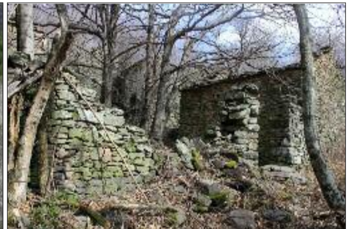
Arrivée au Mas de la Grange