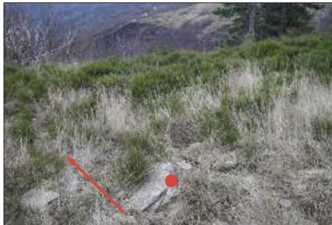
Début de la partie «hors piste». Bien suivre les marques rouges.