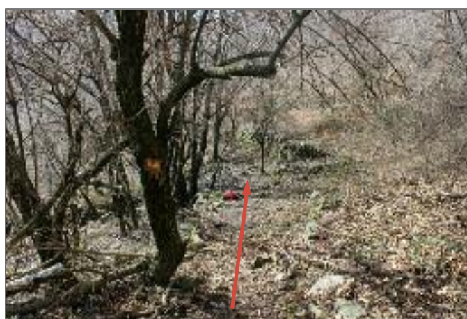
Suivre le balisage pour le retour