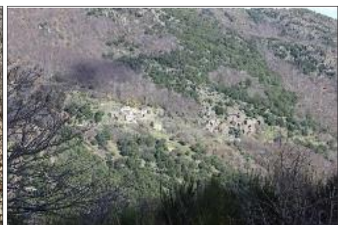
Vue vers Nojaret sur le chemin du retour