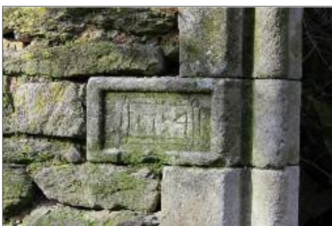
Date de construction de l'habitation