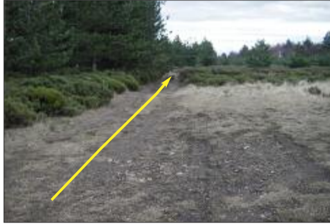
Suivre le chemin