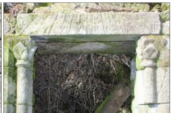
Le linteau formant cadran solaire