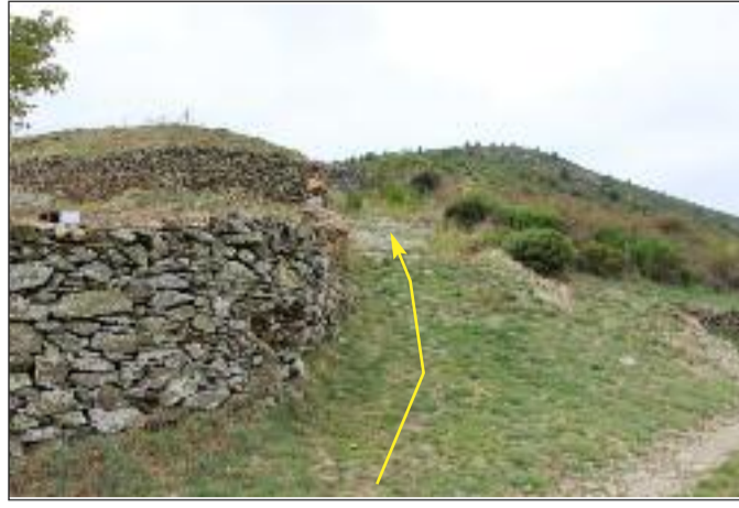
On monte sur le plateau par la draille (GR)