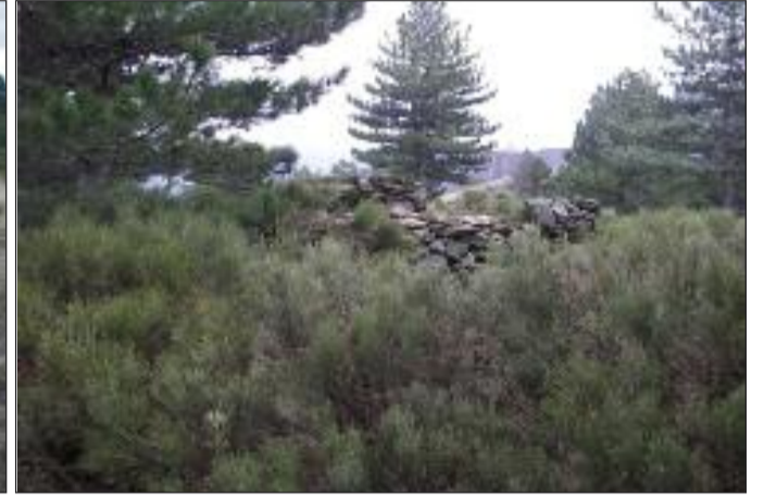
Un clapas (abri de berger)