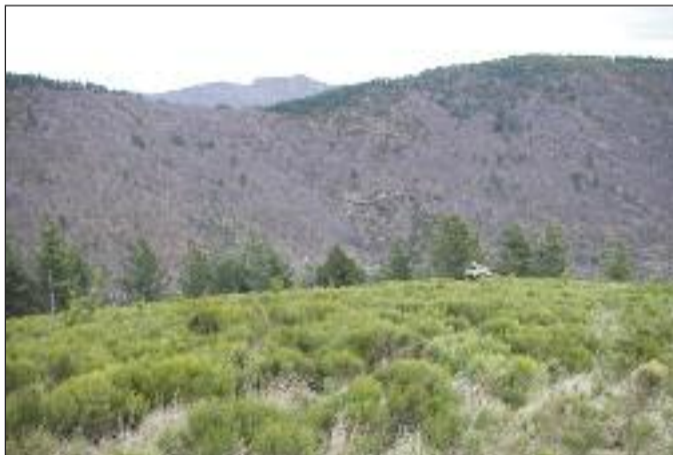
Vue sur le hameau de Coulis, au fond le Serre de Barre