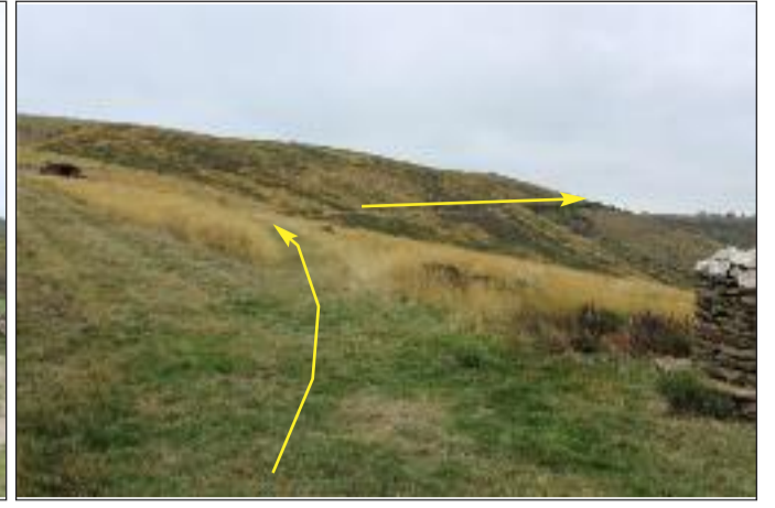
Arrivée au plateau: rester à droite sur le GR