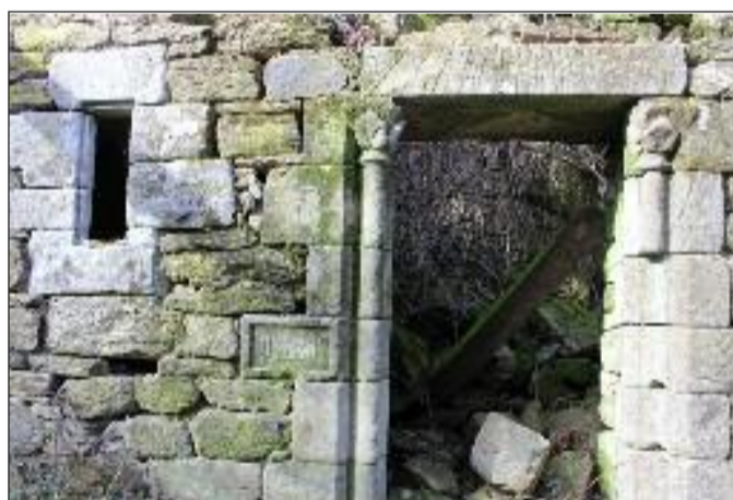
L'entrée de la partie habitation avec les deux colonnettes provenant du prieuré.