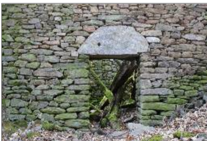
Le porche en demi-lune de la grange