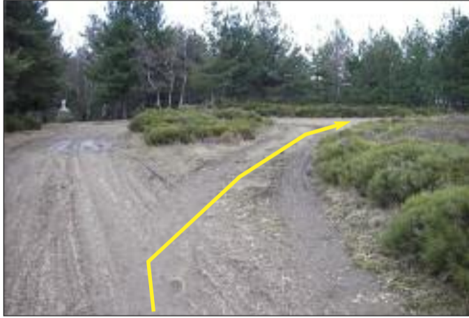
La Garde de Dieu (altitude 949m) N 44°23'01.0" E4°01'09.8"