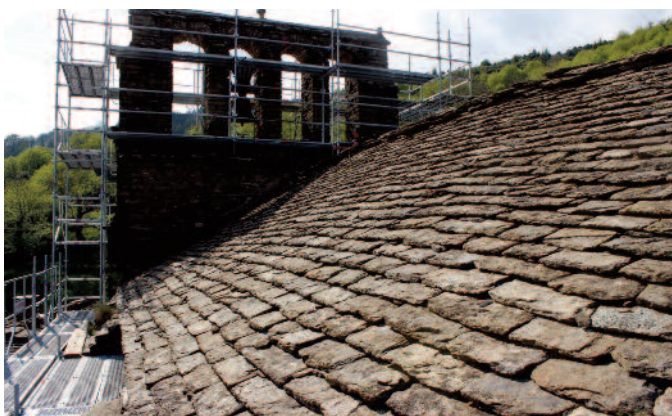
vue sud avant

En regardant bien, on retrouve ces ardoises à l'amorce de la face sud au niveau du chœur. Et lorsqu'on observe la face sud de la nef le résultat est catastrophique avec un changement de matériaux particulièrement inesthétique au niveau du chœur. Ce manque d'unité s'observe en descendant la route depuis la croix de Nojaret. Côté sud on observe également des jointoyages au mortier particulièrement grossiers.