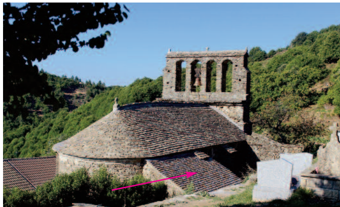
vue nord après

À première vue depuis le cimetière même si la toiture a perdu son cachet rustique, le réemploi des lauzes d'origine sur la partie nord de la nef a permis de conserver une certaine authenticité. On note cependant que ce n'est pas le cas pour la toiture de la sacristie où l'on a utilisé une ardoise non locale qui détone sur le reste (alors que des lauzes locales étaient disponibles en quantité suffisante).