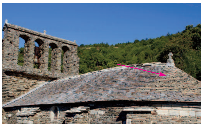
vue sud après