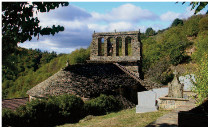
vue nord avant